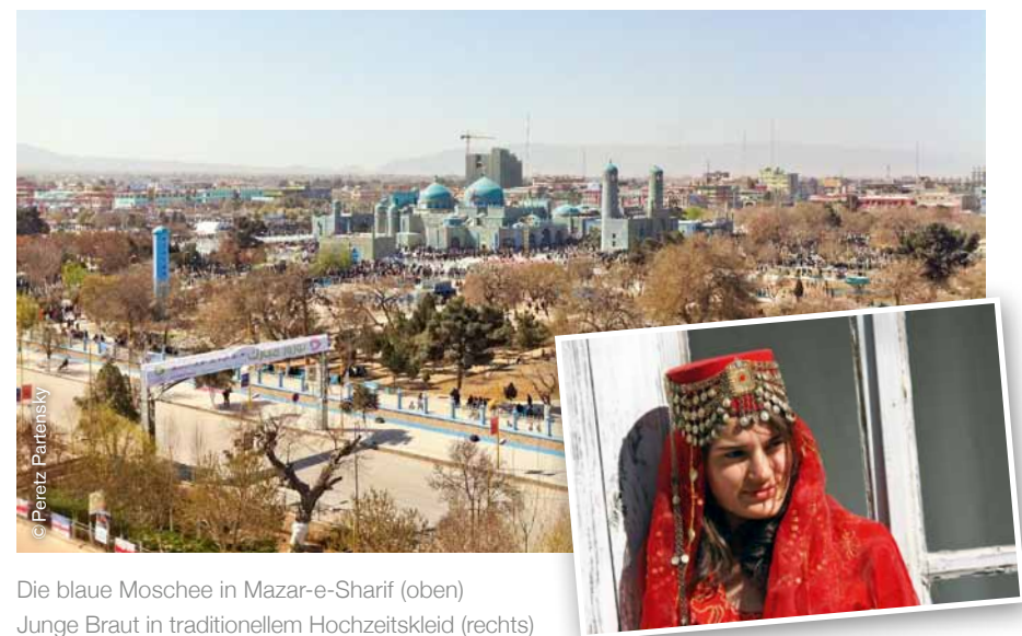
Die blaue Moschee in Mazar-e-Sharif (oben) Junge Braut in traditionellem Hochzeitskleid (rechts)

Im Jahr 2017 konnten wir 1.700 Euro an Spendengeldern nach Afghanistan weiterleiten. Wir danken allen, die sich beteiligt haben, und möchten über die Verwendung berichten.